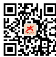
中国大学生在线微博