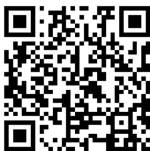
国家开放大学终身教育平台

6. 开设“国开大讲堂·国家安全教育公开课”。国家开放大学联合“央视频”推出国家安全系列公开课，通过国家开放大学终身教育平台向全社会免费播放。即日起至5月31日期间，全国高校学生、国家开放大学学生，以及所有社会学习者均可登录 https://le.ouchn.cn/Event/415 进行免费学习。