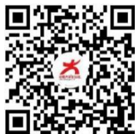
中国大学生在线视频号