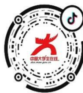
中国大学生在线抖音

2. 举办“全国高校教师国家安全教育教学展示活动”。指导中国高等教育学会保卫学专业委员会和高校思想政治工作创新发展中心举办。线上征集全国高校相关党政干部、专业教师、辅导员、保卫工作者国家安全教育主题教学视频，入围决赛的视频通过全国高校思想政治工作网择优展示。4月11日在重庆师范大学以模拟授课形式开展线下决赛展示，全面展现高校教师开展国家安全教育教学设计、组织课堂教学的能力。