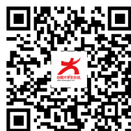
中国大学生在线B站